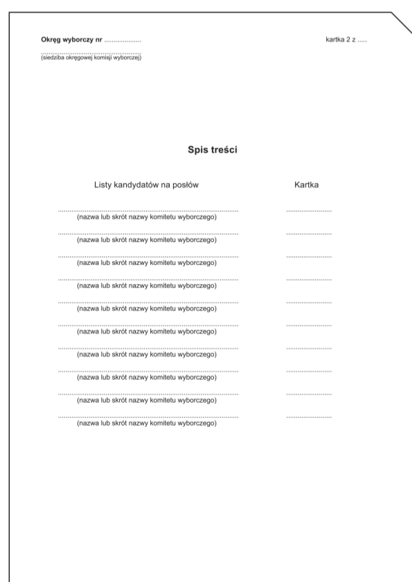
Spis treści (kartka nr 2)